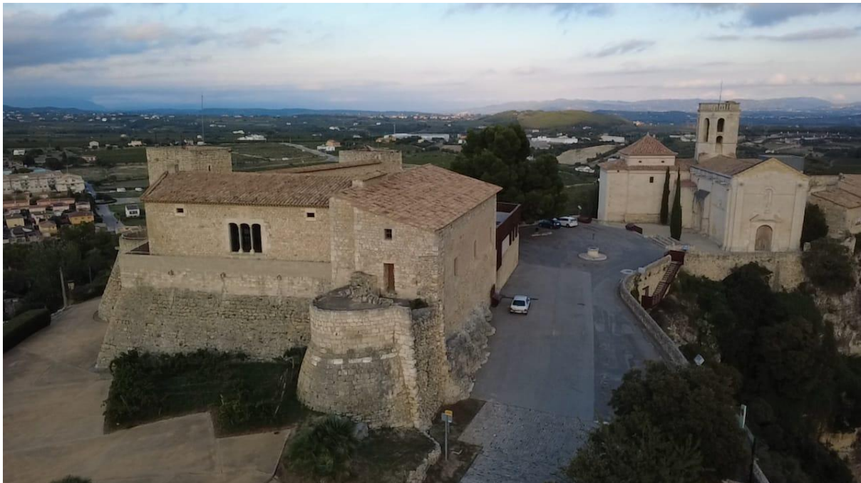
Conjunt monumental de Sant Martí Sarroca

El projecte fomenta, indirectament, l'OSD 11, el de la sostenibilitat . En organitzar més sortides a l'aire lliure, es poden reduir els trajectes amb mitjans de transport més contaminants.