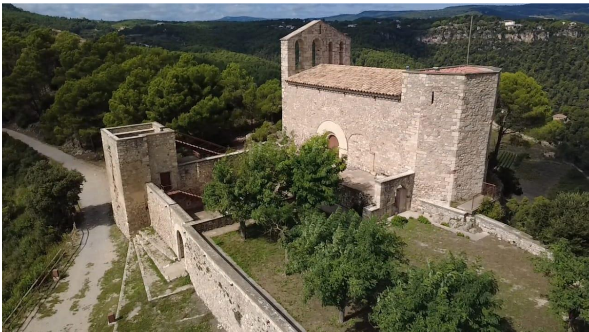
Vista aèria del Castell de Foix i Santuari de Santa Maria de Foix (Torrelles de Foix)

Així que he pensat a crear una ruta pels castells del Penedès, una experiència que ens apropa al passat, ens dona una perspectiva diferent del territori i un valor afegit a la cultura de vi.